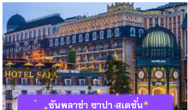
ชั้นพลาซ่า ซาปา สเตชั่น