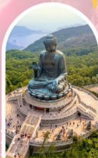
นั่งกระเช้ามองปิง นมัสการพระใหญ่โป่วหลิน