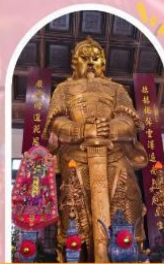
วัดแชกง ขอพรโชคลาก การเงิน และธุรกิจ