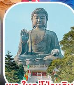
พระใหญ่โป้วหลิน