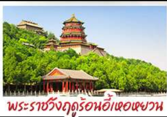
พระราชวังฤดูร้อนอ้าหอยวน

ท่าแพงเมืองจินด่านจวียงกวน - พระราชวังฤดูร้อนอ้าหอยวน สวนจิ่งอัน - วัดลามะ - โมเดลร้านช้อปปิ้ง - โรงแรม 4 ดาว มือพิเศษ เปิดปีกที่ สุกัมองโท MICHELIN GUIDE ร้าน TAO TAO JU