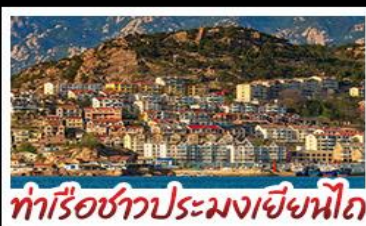
ท่าเรือชาวประมงเยียนโก