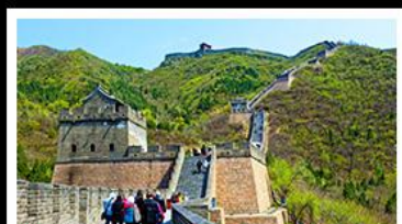
กำแพงเมืองจีนด่านจวิยงกวน