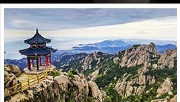
ภูเขาเลาซาน