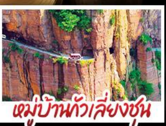
หมู่บ้านกัวเสีงซุน