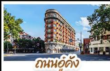
ถนนอุ๊ตัง