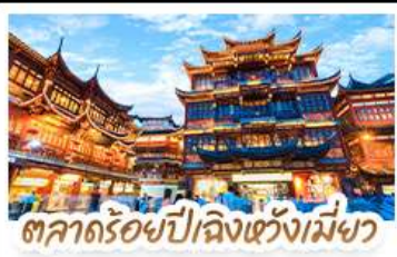
ตลาดร้อยปีเจียงเจียงเม่ียว