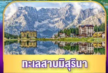
ทะเลสาบมิสุรีนา