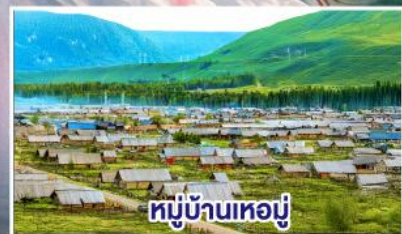
หมู่บ้านหอยมู