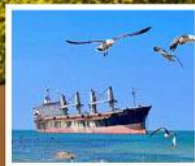
เรือสินค้าเกย์ตันบลูอิส