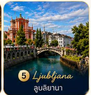
5 Ljubljana ลูบลียานา