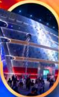
เรือคอะหลุยส์