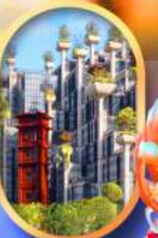
อาคาร 1,000 คับไม้