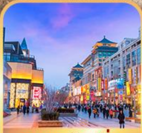
ถนนหวงฟู่จิ่ง