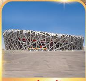
สนามกีฬารังนก