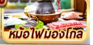
หม้อไฟมองโกเลีย