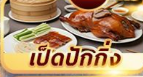
เป็ดปักกิ่ง