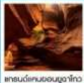
แกรนด์แคนยอนยูลาโกว