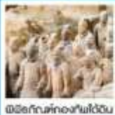
เมืองโบราณที่หลงใหลได้ฉ่ำ