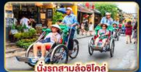
นั่งรถสามล้อฮิโค่