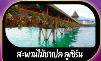
สะพานไม้ชาเปล คูซีน