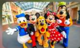
ดิสนีย์อีسر