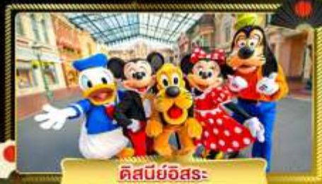
ดิสนีย์อิสระ