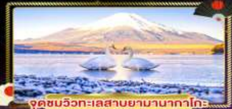
จุดชมวิวกะเลสาบยามานากาโกะ