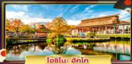
ไอชิโนะ ฮิโตะ

เดินสัมผัสอากาศบริสุทธิ์ พร้อมความสดชื่น ๗ ลวเซซากุระจิโระริกะฟูจิ