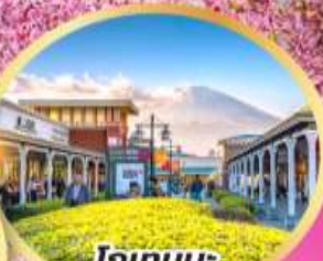
โทเทมบะ พรีเมียมเอ้าท์เล็ต