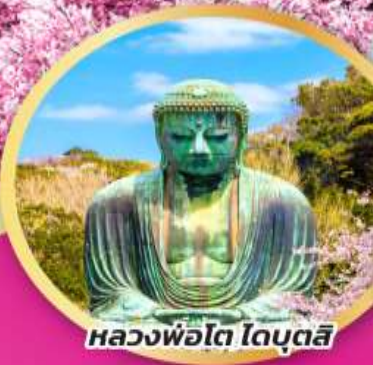
หลวงพ่อโต โดบุตสึ