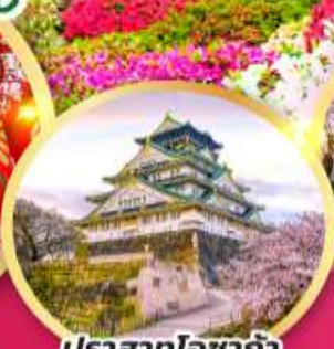
ปราสาทโซาก้า