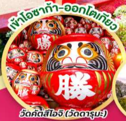
เข้าโซาก้า-ออกโตเกียว