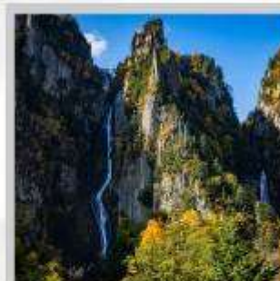
“GINGA & RYUSEI FALLS”

สัมผัสความสวยงามของดอกไม้ “ดอกทิวลิป ณ สวนคะมิยูเบตสึ” ที่มีมากกว่า 120 สายพันธุ์ เพลิดเพลินกับ “ถ้ำน้ำแข็งไอซ์ พาวีเลียน” ที่มีหยดน้ำแข็งรูปร่างสวยงามต่างๆ ที่อุณหภูมิ -20 องศา “ฟาร์มสุนัขจิ้งจอกฮอกไกโด” ฟาร์มสุนัขจิ้งจอกแห่งเดียวของเกาะฮอกไกโด สายพันธุ์ท้องถิ่นคือ สายพันธุ์ Ezo red fox ชมกระท่อมไม้หลังน้อยในดินแดนเทพนิยาย ณ “หมู่บ้านนิงเกิลเทอร์เรซ” จำหน่ายสินค้าจำพวกงานฝีมือต่างๆ นำท่านขึ้นชมวิวมุมสูง “นั่งกระเช้าภูเขาไฟโมอิวะ” เพื่อชมทัศนียภาพของเมืองซัปโปโรจากมุมสูง ชม “ทุ่งดอกพืชมอส ณ สวนทาคิโนะอุเอะ” ด้วยพรมสีเขียวที่มีพื้นที่ขนาดใหญ่ถึง 100,000 ตารางเมตร