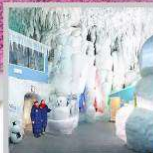
“KAMIKAWA ICE PAVILLION”