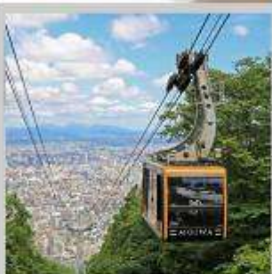
“MT. MOIWA ROPEWAY”