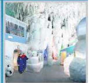
"KAMIKAWA ICE PAVILLION"