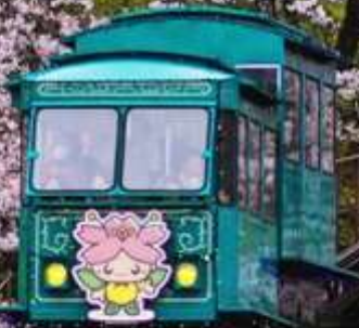
"FUNAOKA JOSHI + HITOME SENBONZAKURA"