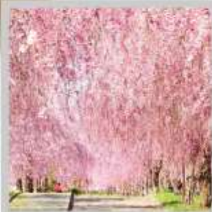
"NICCHUSEN WEEPING SAKURA"