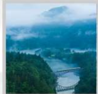
"TADAMI FIRST BRIDGE"

เปลี่ยนอิริยาบถสู่การเปิดประสบการณ์ "นั่งรถไฟชินคันเซน (SHINKANSEN)" รถไฟที่วิ่งเร็วที่สุดในญี่ปุ่น ชม "สวนนิกชูเซน ซาคุระสายพันธุ์จิคาระ" ที่ซาคุระมีลักษณะโดดเด่นกิ่งที่โน้มต่ำมากกว่า 1,000 ต้น เดินเล่น "หมู่บ้านกินชินออนเซ็น" หมู่บ้านออนเซ็นเล็กๆ ที่มีเรียวกังเรียงรายเลียบบแม่น้ำ และมีชื่อเสียงยาวนาน ส่องเรือชมความงาม "หุบเขาเกบิเค" เรือไม้ขนาดใหญ่ไม่มีหลังคาสามารถชมวิวตลอด 2 ฝั่งน้ำได้อย่างตื่นตาตื่นใจ ชมความงามของ "ทุ่งพืชมอส สวนชิบะซาคุระเมืองอิจิโค" มนต์เสน่ห์..พระธรรมชาติสีชมพูหลากสีสดใส ตระการตาดอกซาคุระ ณ "สวนฟูนาโอกะ โจชิ" เนินเขาสูงซึ่งเต็มไปด้วยต้นซาคุระกว่า 1,000 ต้น ตามแนวแม่น้ำชิโรอิชิ