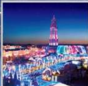
"HUIS TEN BOSCH"