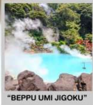
"BEPPU UMI JIGOKU"