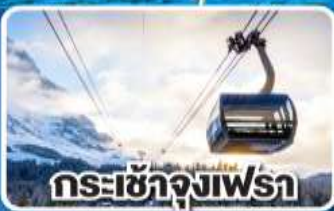
กระเช้าจุงเฟรา