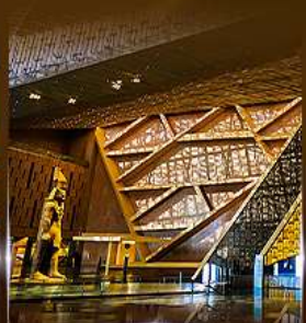
พิพิธภัณฑ์แกรนด์อียิปต์ (GEM)