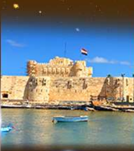
บึงปราราก Quite Bay