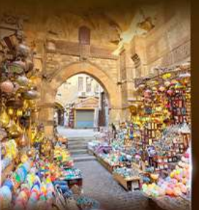
ตลาดฟานเวลคาส์