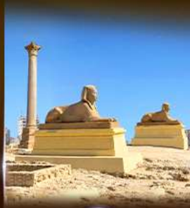
เสารัมปอนเบย์