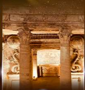
สุสานใต้ดินอเล็กซานเดรีย