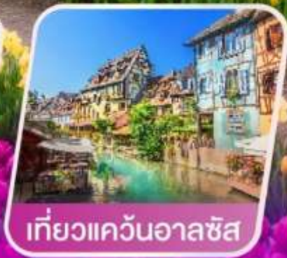
เที่ยวแคว้นอาลซัส