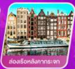
ล่องเรือหลังคากระซก