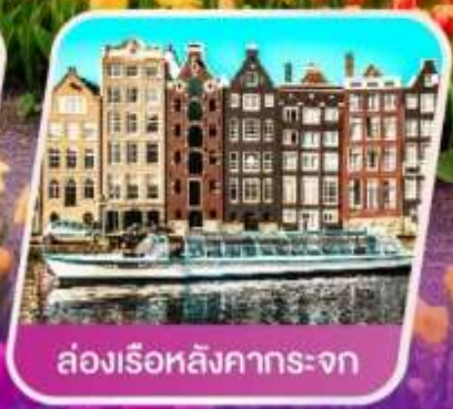
ล่องเรือหลังคากระຈก