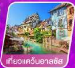
เที่ยวแควินออลซัส