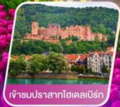
เข้าชมปราสาทไฮเคลบิรน์