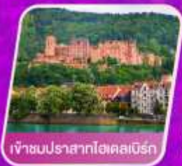
เจ้าชมนปราสาทไฮคสเบิร์ก

🏠 โรงแรม 4 ดาว 🍴 อาหาร 14 มื้อ 🚿 โทศน้ำ เทียว 🚰 น้ำหนัก 23 กก.