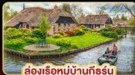
ล่องเรือหมู่บ้านกังหัน