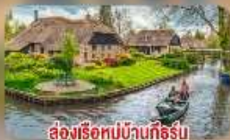
ล่องเรือหมู่บ้านทีรูร์น