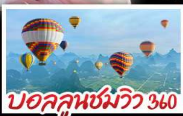
บอลลูนชมวิว 360