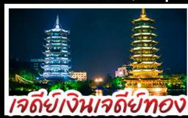
เจดีย์เงินเจดีย์ทอง

ล่องแพไม้ไผ่ แม่น้ำหลี่เจียง - ภูเขาหุยี้ กระเช้า ไปกลับ บ้านบันไดหลงเซิน - เจดีย์เงินเจดีย์ทองวิวห้า นางวงช้าง - บอลลูนชมวิว 360 แม่บุพิศข บุปผ์ตึงย่างบาร์บิคิว ปลาอบเบียร์ เผือกคริสตล สุกี่เห็น