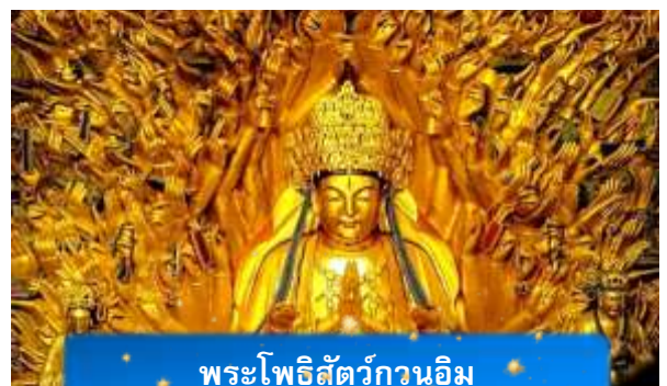
พระโพธิสัตว์กวนอิม

เช้า บริการอาหารเช้า ณ ห้องอาหารของโรงแรม นำท่านเดินทางสู่ มรดกโลกอุทยานผาหินแกะสลักต้าจู่ ศิลปะหินแกะสลักอันล้ำค่าแห่งเมืองฉงชิ่งมรดกโลกที่องค์การยูเนสโกขึ้นทะเบียนเมื่อปี ค.ศ. 1999 ตั้งอยู่ทางตะวันตกของนครฉงชิ่ง ประเทศจีน ศิลปะหินแกะสลักเหล่านี้สร้างขึ้นตั้งแต่ราชวงศ์ถังจนถึงราชวงศ์ซ่ง มีอายุมากกว่า 1,000 ปี โดดเด่นด้วยงานแกะสลักทางพุทธศาสนาที่งดงามและยังคงสภาพสมบูรณ์ (ใช้เวลาเดินทางประมาณ 1-2 ชั่วโมง)