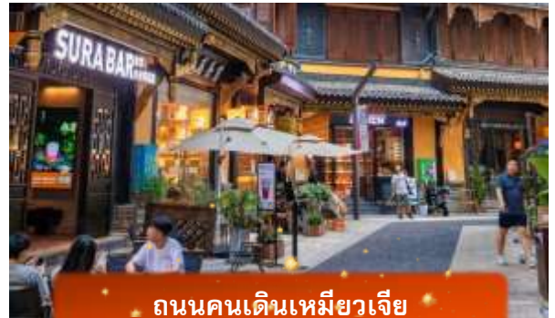
ถนนคนเดินเหมียวเจีย

เที่ยง บริการอาหารกลางวัน ณ ภัตตาคาร พิเศษ ... เมนูเปิดปีกกิ้ง