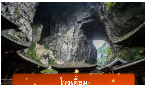
โรงเตี๊ยม

นำท่านลง ลิฟต์แก้ว สู่หุบเหวลึก 80 เมตร ชมกลุ่มสะพานสวรรค์ – สะพานหินธรรมชาติใหญ่ที่สุดในเอเชีย 3 แห่ง ได้แก่ สะพานมังกรสวรรค์ มังกรเฉียว และมังกรดำ ท่ามกลางธรรมชาติสุดอลังการ พร้อมแวะโรงเตี๊ยมโบราณฉากจริงจากภาพยนตร์ “ศึกโค่นบัลลังก์วังทอง” รวมค่าลิฟท์ 1 เที่ยว