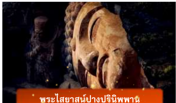
พระไสยาสน์ปางปรินิพพาน