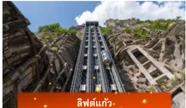
ลิฟต์แก้ว