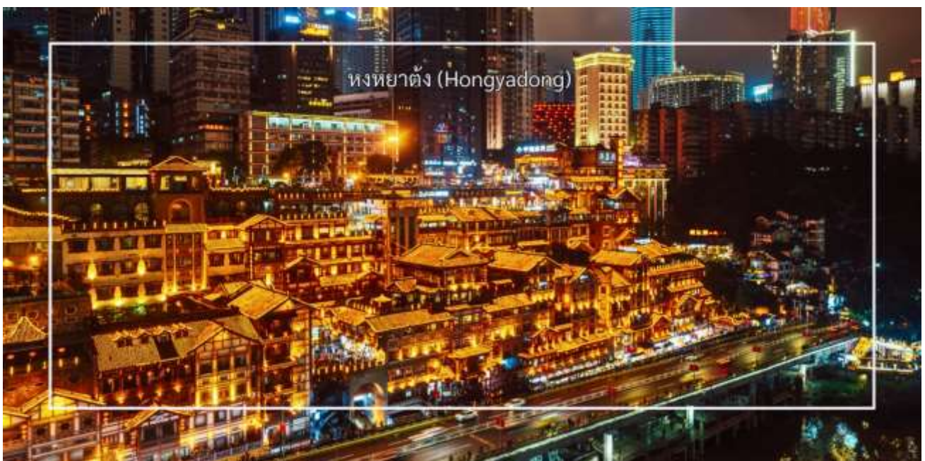
หงหยาดัง (Hongyadong)

นำท่านสู่ หงหยาดัง (Hongyadong) หรือที่เรียกว่า "Hongya Cave" เป็นสถานที่ท่องเที่ยวที่มีชื่อเสียงในเมืองฉงชิ่ง โดยตั้งอยู่ริมแม่น้ำแยงซี มีบรรยากาศที่เต็มไปด้วยวัฒนธรรมและประวัติศาสตร์ ตลาดหงหยาดังเป็นพื้นที่ที่มีอาคารแบบดั้งเดิมที่สร้างขึ้นในสไตล์สถาปัตยกรรมแบบซิโน-ทิเบต โดยมีร้านค้า ร้านอาหาร และบาร์จำนวนมาก ที่นี่คุณสามารถลิ้มลองอาหารท้องถิ่นที่อร่อย เช่น และขนมพื้นเมืองอื่นๆ นอกจากนี้ ตลาดหงหยาดังยังมีวิวทิวทัศน์ที่สวยงาม โดยเฉพาะในช่วงเย็นเมื่อไฟประดับส่องสว่าง ที่ทำให้บรรยากาศมีความโรแมนติกและน่าตื่นตึ่ง คุณสามารถเดินเล่นตามทางเดินที่มีการจัดแสดงงานศิลปะและสินค้าท้องถิ่น