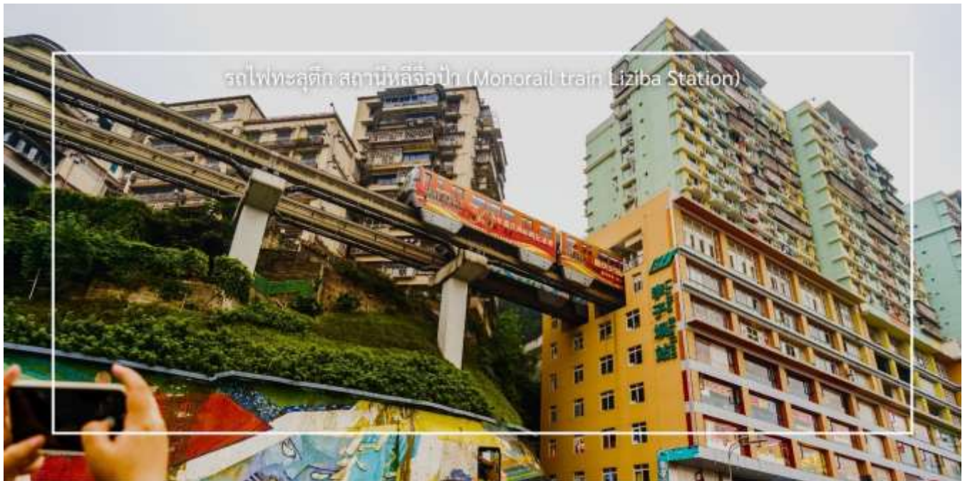
รถไฟทะลุตึก สถานีหลี่จื่อป้า (Monorail train Liziba Station)

จากนั้นนำท่าน ชมรถไฟทะลุตึก (Monorail Train) (รวมนั่งรถไฟทะลุตึก) เป็นหนึ่งในประสบการณ์ที่น่าสนใจและเป็นเอกลักษณ์ในเมืองฉงชิ่ง รถไฟเส้นนี้มีเส้นทางที่ผ่านอาคารและที่อยู่อาศัย ทำให้ผู้โดยสารรู้สึกเหมือนกำลังนั่งรถไฟที่ทะลุผ่านตึกสูง สามารถขึ้นได้ที่ สถานีหลี่จื่อป้า (Liziba Station) ซึ่งตั้งอยู่ในพื้นที่ที่มีความหนาแน่นของประชากร การนั่งรถไฟทะลุตึกนี้เป็นวิธีที่ยอดเยี่ยมในการสัมผัสกับวัฒนธรรมเมืองฉงชิ่งและชื่นชมกับการ