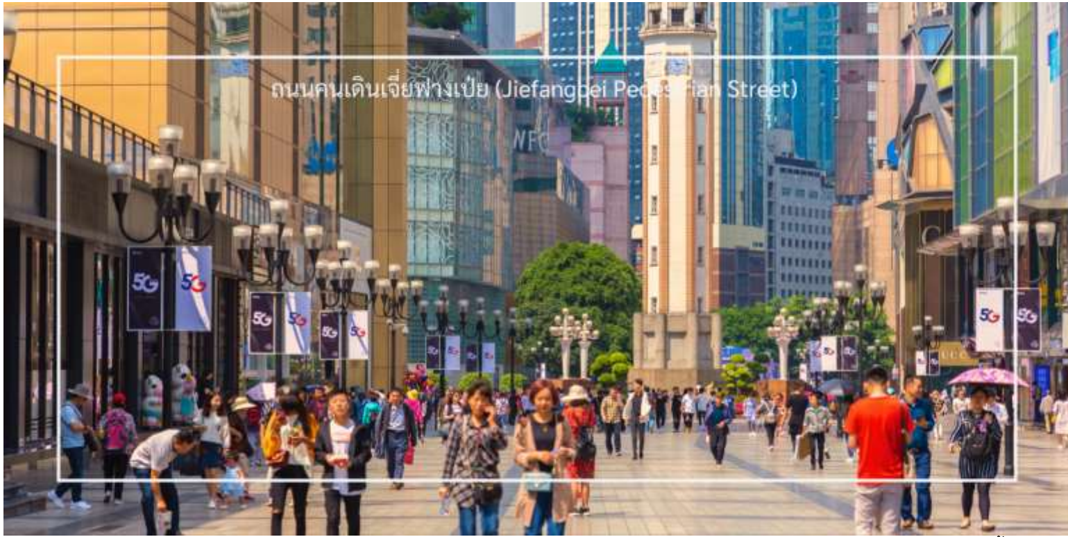
ถนนคนเดินเจียงเป่ย์ (Jiefangbei Pedestrian Street)

นำท่านสู่ ถนนคนเดิน กวนอินเฉียว (Guanyinqiao) ย่านหัวใจการค้าและแสงสีแห่งมหานครฉงชิ่ง (อิสระ ช้อปปิ้งและอาหารเย็น) สามารถเพลิดเพลินกับการช้อปปิ้งทั้งของฝากและอาหาร ขนม ของว่าง ซิมอาหารพื้นเมือง และเก็บภาพสีสันยามราตรีอันตระการตา ต็มด้าบรรยากาศสุดทันสมัย ณ ย่านกวนอินเฉียว ศูนย์กลางการช้อปปิ้งและความบันเทิงที่ใหญ่ที่สุดในเขตเจียงเป่ย์ ถนนคนเดินความยาวกว่า 700 เมตรแห่งนี้ เต็มไปด้วยห้างสรรพสินค้าหรู ร้านแฟชั่นระดับโลก และร้านอาหารชื่อดัง ที่พร้อมตอบโจทย์ทุกสไตล์การท่องเที่ยวยามค่ำคืน กวนอินเฉียวจะเปล่งประกายไปด้วยแสงไฟนีออนและจอ LED ขนาดยักษ์ สร้างบรรยากาศคึกคักไม่แพ้มหานครใดในเอเชีย จนได้รับการขนานนามว่า “ชิบูย่าแห่งฉงชิ่ง” นักท่องเที่ยวสามารถเพลิดเพลินกับการช้อปปิ้ง