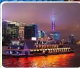
ส่องเรือแม่น้ำหวงผู่