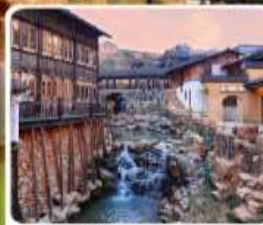
เมืองโบราณเหย้าหู