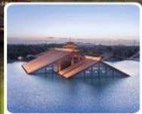
พิพิธภัณฑ์ไดน้ำ กวางฟู่หลิน