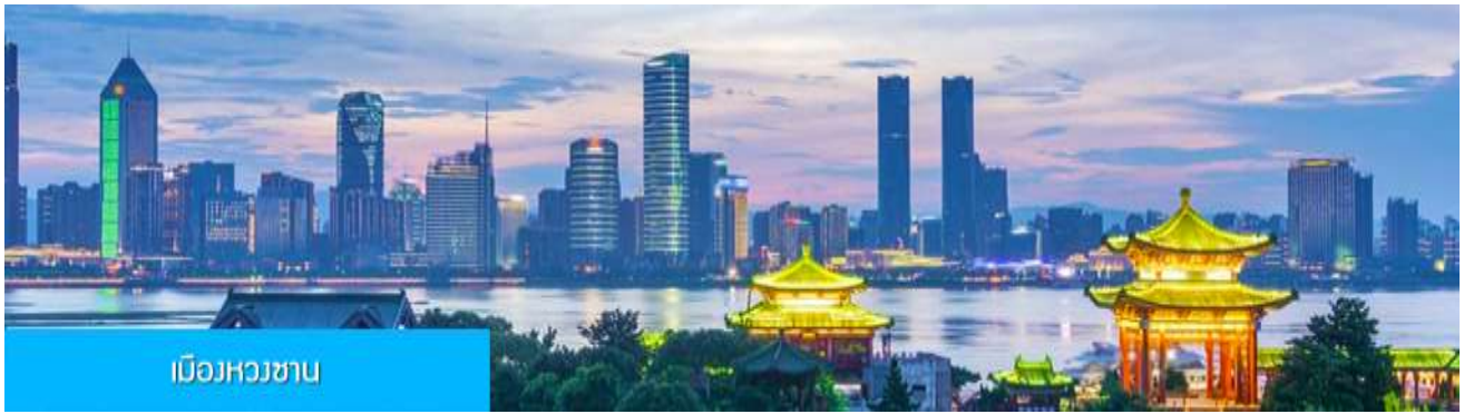
เมืองหางซ่าน