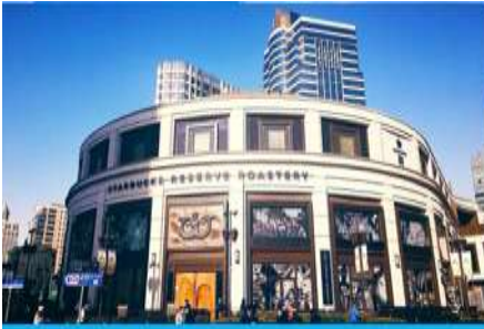
Starbucks Reserve Roastery