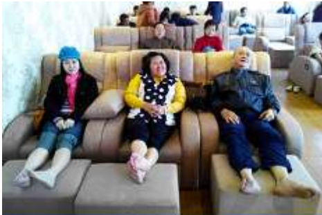
ศูนย์วิจัยแพทย์แผนจีน