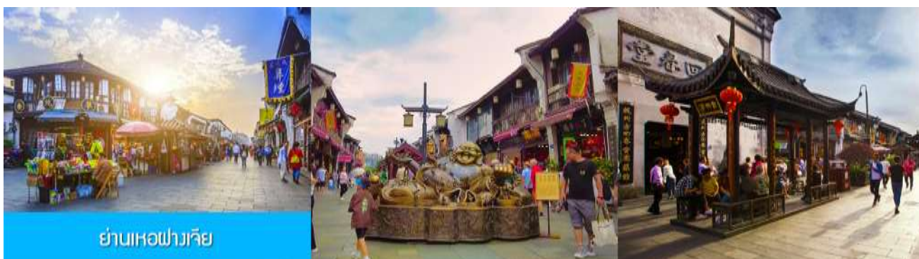
ย่านเหอฝางเจี๋ย