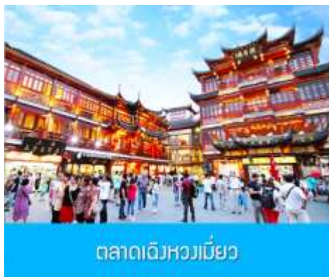
ตลาดเจิงหวงเมี่ยว

เช้า รับประทานอาหารเช้า ณ ห้องอาหารของโรงแรม (6)