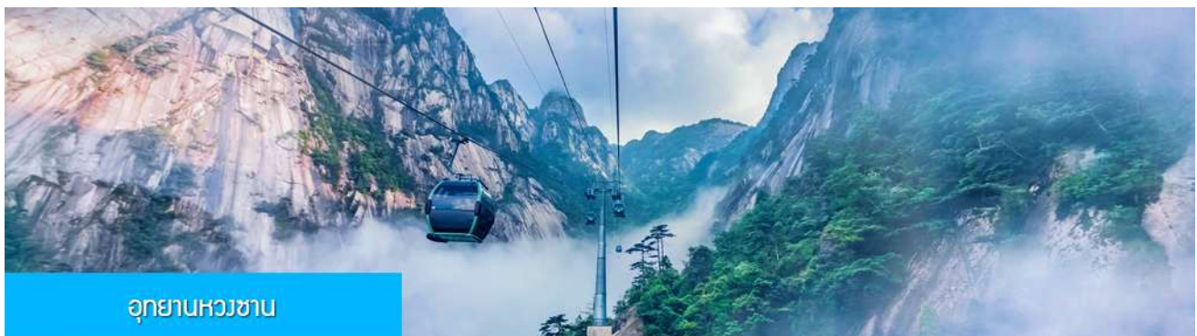
อุทยานหวงซาน