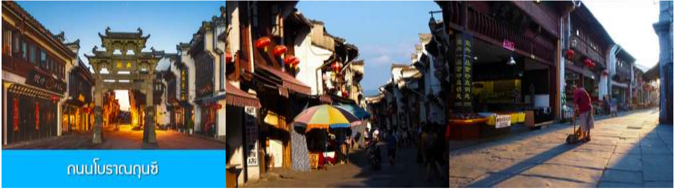
ถนนโบราณกุนซี

นำท่านเที่ยวชม ถนนโบราณกุนซี 屯溪老街 ถนนที่เป็นย่านการค้าโบราณในยุคราชวงศ์ซ่งได้อายุกว่า 700 ปี ถนนมีความยาวราว 1272 เมตร สองฝั่งถนนมีอาคารบ้านเรือนโบราณสไตล์หุยโจวที่สร้างในยุคปลายราชวงศ์หมิงและราชวงศ์ชิงที่ถูกอนุรักษ์ไว้เป็นอย่างดี ปัจจุบันยังมีห้างร้านโบราณ อาทิ ร้านขายโบราณวัตถุ ร้านขายหยก ร้านขายภาพเขียนและอักษรพู่กันโบราณ ร้านอาหารพื้นเมือง ร้านขายของที่ระลึก ฯลฯ นอกจากนี้ร้านค้าและอาคารบ้านเรือนโบราณที่นี้ยังเป็นแหล่งรวมของนักท่องเที่ยวที่มาชิมอาหารพื้นเมือง เดินช้อปปิ้งและถ่ายภาพ เซ็คอิน