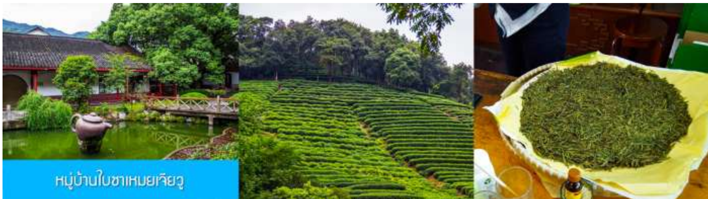
หมู่บ้านใบชาเหมยเจี๋ยวู