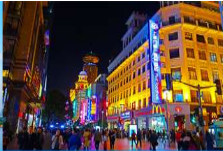
ถนนคนเดินหนานจิงจู่