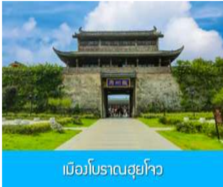
เมืองโบราณฮุยโจว