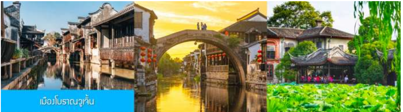
เมืองโบราณวูเจิน