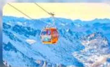
ต้ากู่ปิงชว่น