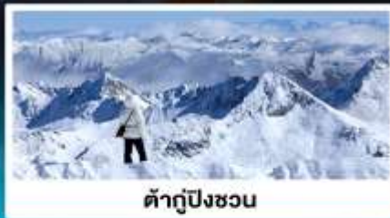
ต้ากู่ปิงชว่น