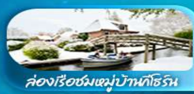
ล่องเรือชมหมู่บ้านทอร์น

เดินทาง 29 ม.ค. - 05 ก.พ. 69 25 ก.พ. - 04 มี.ค. 69 / 28 พ.ค. - 04 มิ.ย. 69