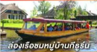
ล่องเรือชมหมู่บ้านกังหัน