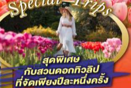
สุดพิเศษ กับสวนดอกทิวลิป ที่จัดเพียงปีละหนึ่งครั้ง