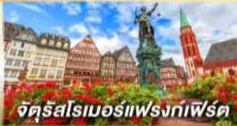
จัตุรัสโรเมอร์แฟรงก์เฟิร์ต