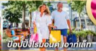
ป๊อปป์ปิงโรมอนด์ ไอทาลี