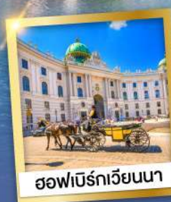
ฮอฟเบิร์กเวียนนา