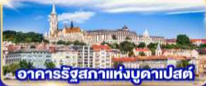
อาคารรัฐสภาแห่งบูดาเปสต์