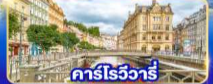
คาร์โรวัวร์