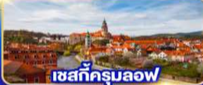
เซสท์ครุมลอฟ