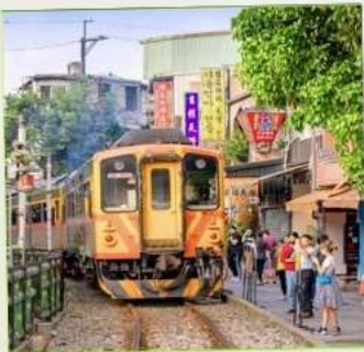
สถานีรถไฟซือเฟิ่น