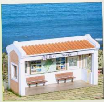
Tiaoshi Bus Station