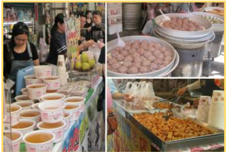
เที่ยง ๑๐ อิสระรับประทานอาหาร ร้านอาหารย่าน ถนนโบราณจินซาน (ไม่รวมค่าอาหาร)