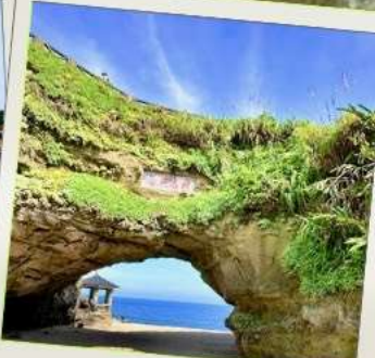
ถ้ำสี่เหมิน