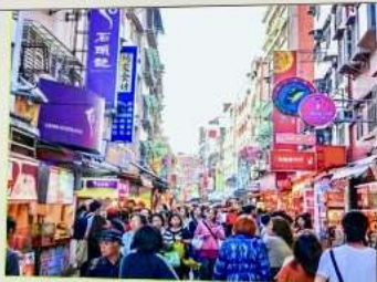
ถนนโบราณตั้นสุ่ย