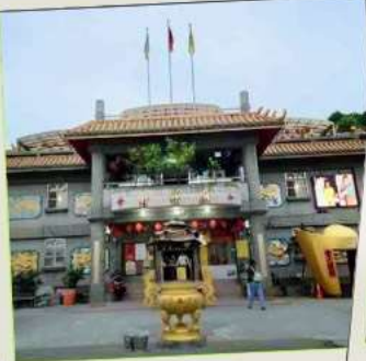
วัดจินซาน (โชคลาก)